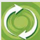
AbfallApp LK BT

Restmüll-, Bio-, Papier- und Gelbe Tonne – was wo hineingehört, erfahren Sie auf den Seiten 8 und 9 in dieser Broschüre oder beim Infotelefon: 0921 728-282, auf unserer Homepage www.landkreis-bayreuth.de/abfall oder über unsere AbfallApp.